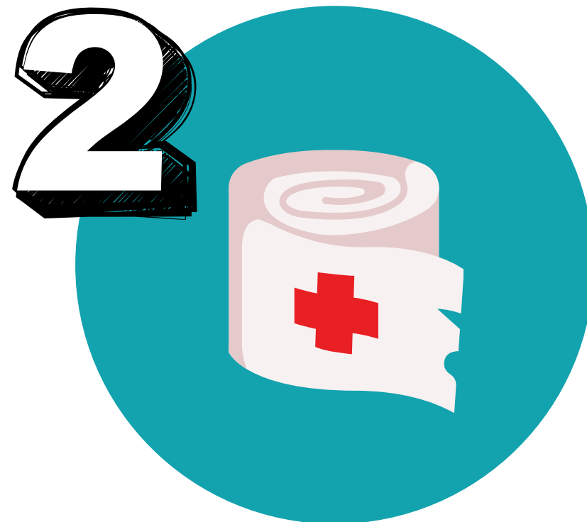
Blutung mit sterilem Druckverband stillen